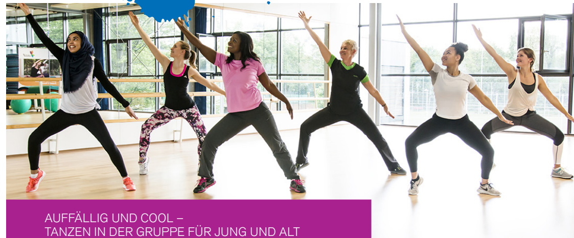
AUFFÄLLIG UND COOL – TANZEN IN DER GRUPPE FÜR JUNG UND ALT

Lyrical Jazz Dance zeichnet sich durch eine ausdrucksstarke Interpretation von Musik und Text aus. Große lange Bewegungen wechseln sich dynamisch mit kleinen starken Akzenten ab. Dieser Kontrast an Körperspannung gibt allen Teilnehmern die Möglichkeit ihrem